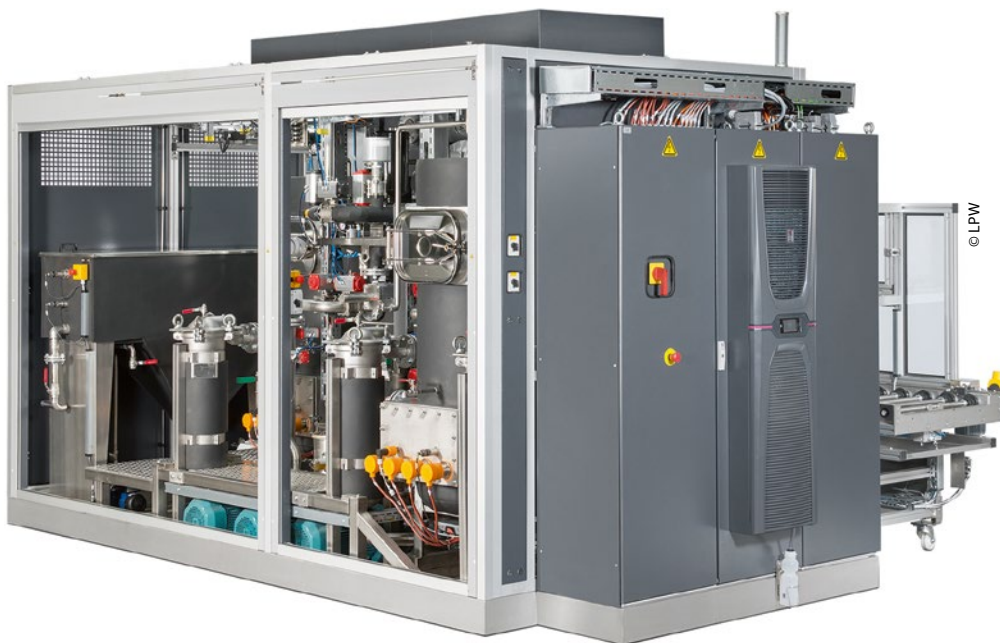
Moderne modulare Kammeranlagensysteme erlauben die Integration der am Markt bekannten sowie neuer Reinigungs- und Trocknungsverfahren für filmische und partikuläre Aufgabenstellungen.

gungen und Prozesse aktiv mit einbezogen.